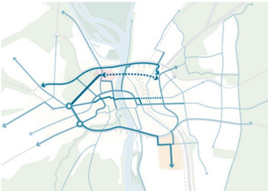
Figuur 35: Groene fietssingel, uit Visie Kennedybrugtracé door B+B landschapsarchitecten

De bij behorende plaatjes geven een vertekend beeld. De suggestie wordt gewekt als zou hier een geschikte maaswijdte voor het fietsverkeer getoond worden. Dit is niet zo gelukkig in de huidige realiteit.